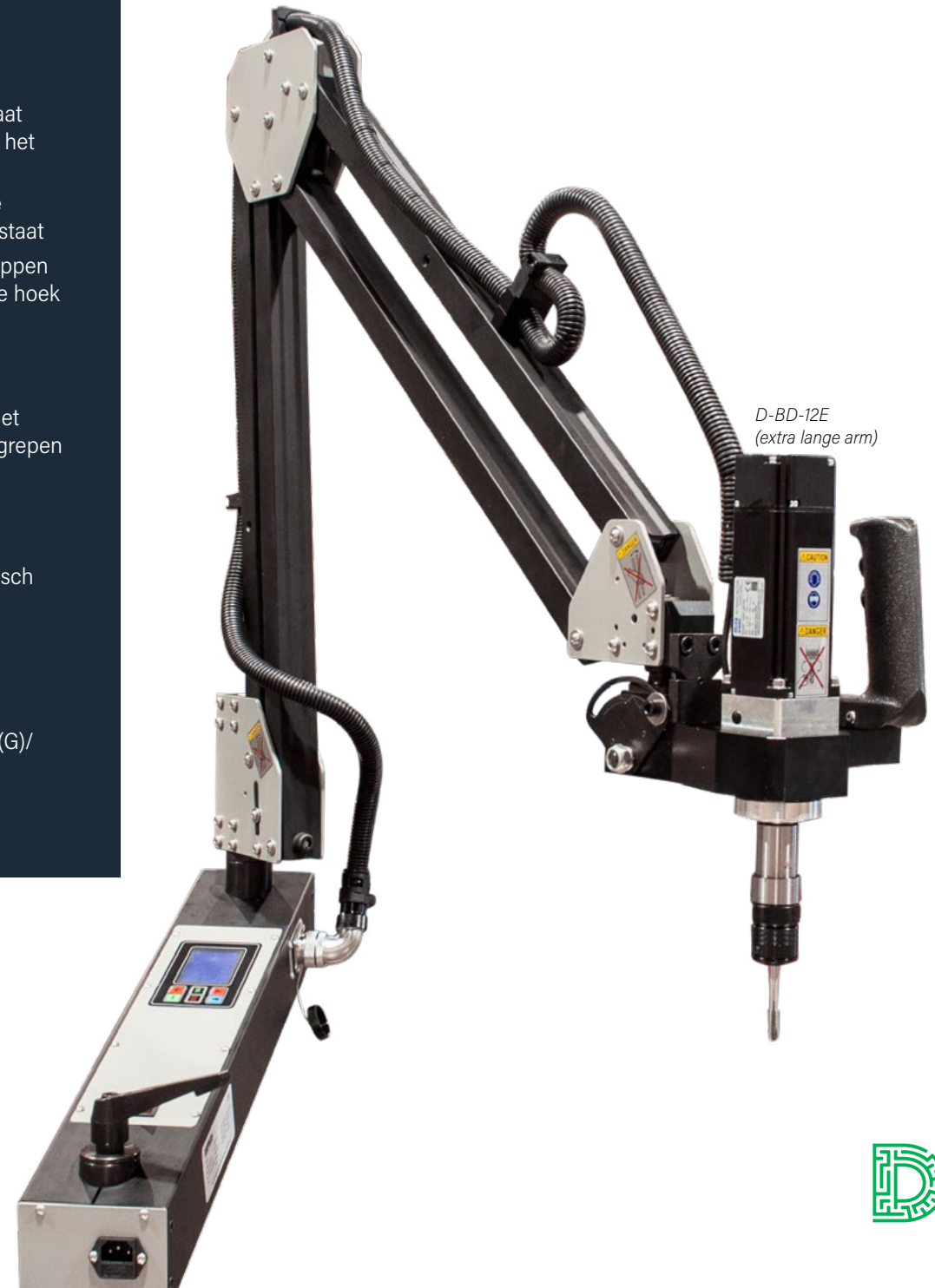
D-BD-12E (extra lange arm)